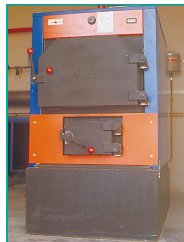
Vue de la chaudière.

« A l'heure où nous sommes de plus en plus sensibilisés au respect de l'environnement, l'utilisation du bois-énergie s'inscrit pleinement dans cette prise de conscience. Les principaux objectifs de cette installation de chauffage automatique au bois sont l'utilisation de ressources locales et les aspects pédagogiques et exemplaires. De plus, nous participons à la diminution des rejets de gaz à effet de serre et des polluants atmosphériques. Cette installation devrait également permettre à la commune de réaliser d'importantes économies financières, mais nous ne pouvons pas le certifier, c'est encore tôt. »