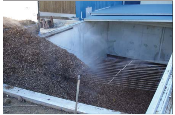
Livraison du bois en silo.

À Saint-Charles, la puissance retenue pour la chaudière bois est de 1 200 kW, ce qui permet au bois de couvrir au minimum 80 % des besoins annuels du réseau. La chaufferie gaz a été dimensionnée pour fonctionner en secours total le cas échéant : 3 945 kW répartis sur trois chaudières (deux chaudières d'appoint de 1 230 kW et 790 kW et une chaudière de secours de 1 925 kW).