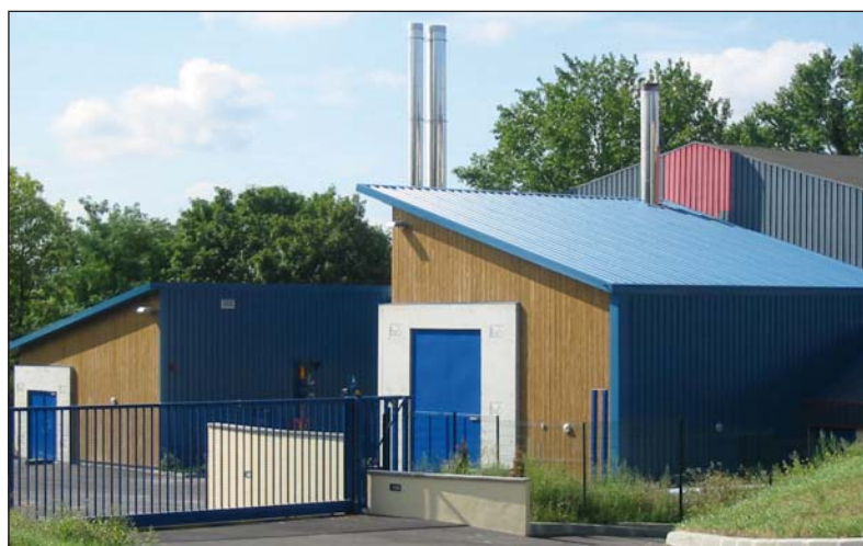
Chaufferie bois (au premier plan) et chaufferie gaz (au second plan).

Désirant maîtriser ses charges de chauffage et recourir à une énergie propre et moins soumise aux aléas de prix que le sont les énergies fossiles, le lycée Saint-Charles a opté pour une chaufferie centrale au bois. Entièrement automatisée et distribuant l'énergie aux différents bâtiments du lycée via un réseau de chaleur nouvellement créé, l'installation consomme du bois d'élagage décheté (sous forme de "plaquettes"). Elle couvre 80 % des besoins annuels de chauffage et d'eau chaude sanitaire du lycée. Une chaufferie gaz fournit le complément (20 %). En amont de cette réalisation, le lycée n'a pas oublié de réaliser les indispensables travaux d'économie d'énergie. Situé sur un site classé, cet établissement d'enseignement privé accueille 2 200 élèves. Il intègre un internat et un restaurant scolaire (2 000 repas par jour). La surface chauffée est de 24 000 m 2 . Le site était initialement chauffé par trois chaufferies séparées équipées de chaudières fioul âgées de 20 à 40 ans et de chaudières électriques d'une quinzaine d'années. En 2002, l'établissement a bénéficié du soutien technique et financier de l'ARENE et de la délégation régionale de l'ADEME, pour réaliser une étude de faisabilité concernant le remplacement des chaudières fioul/électriques par un système énergétique plus performant.