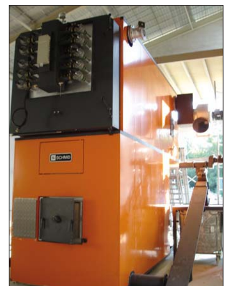
La chaudière bois (1,2 MW).