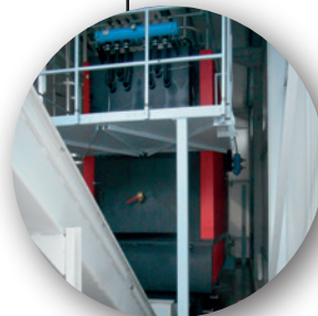
Chaudière CE 150 - 1,5 MW