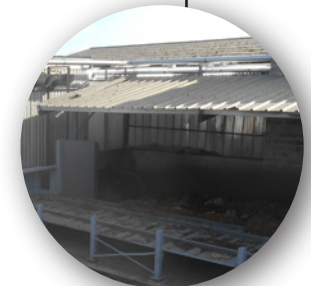
Extraction silo métallique - 120m 3