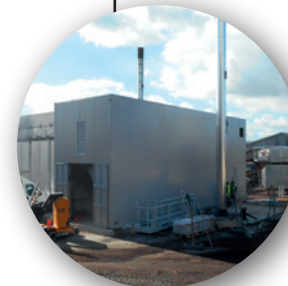
Conteneur chaudière L x l x h : 14 x 4,4 x 5,9 m