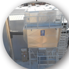
Traitement des fumées Electrofiltre - rejets <20mg/Nm 3