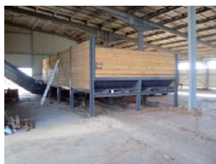
Silo relié à la chaudière