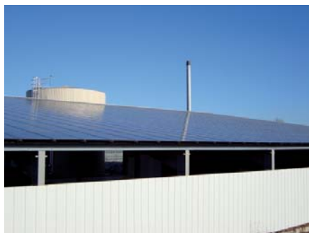
Toiture du hangar de stockage en photovoltaïque

Nature : 25% plaquette forestière 75% mélange de plaquette industrielle et de bois de rebut Granulométrie moyenne : C1, C2, C3, C4 Humidité moyenne : de 20 à 50% sur brut (chaufferie équipée d'un système de séchage de la plaquette)