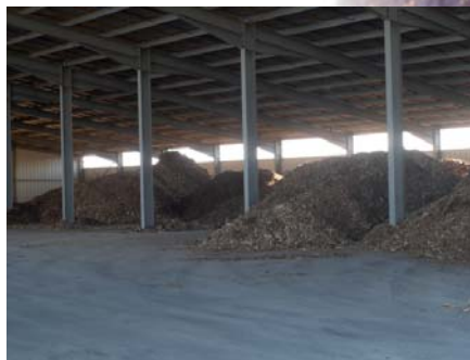
Hangar de stockage de la plaquette

Consommation : 2 500 t/an (soit 8 750 MAP) Energie produite : 5 900 MWh/an Prix du combustible : 30 à 35 € la tonne