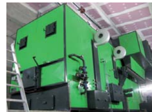
Chaudière POLZENITH GmbH 1,8 MWatt

Quantité de cendres produites : 2 m 3 par semaine