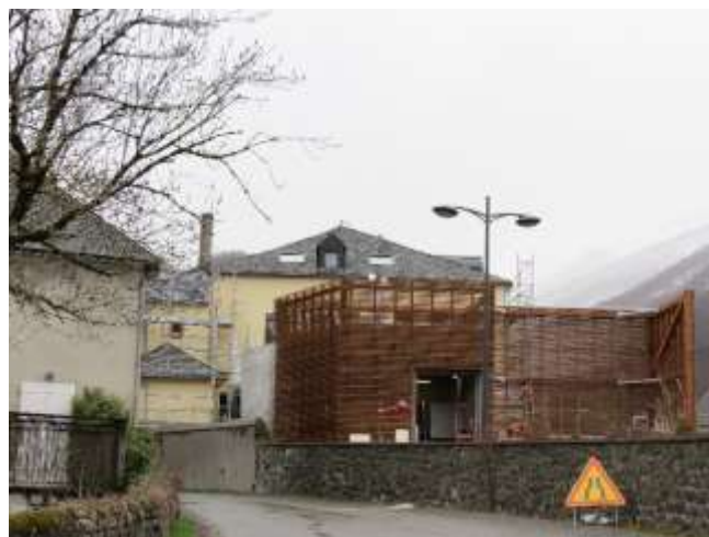
Chaufferie Bois Energie de Bedous.

Système d'appoint : Energie Fioul, 150 kW