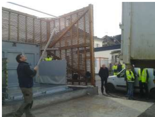
Livraison par camion polybenne de 35m 3 .

Provenance : Première livraison par une entreprise d'élagage Sb-Paysage.