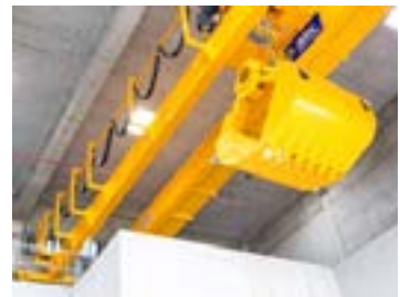
Le grappin du silo semi-enterré