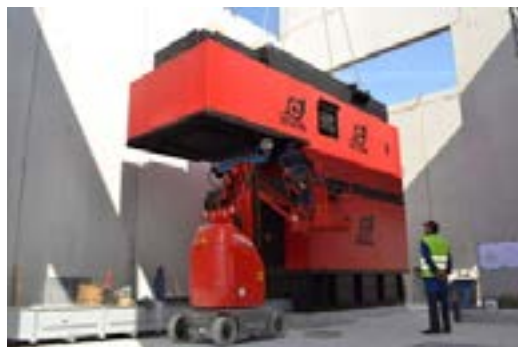
Mise en place de la chaudière bois de 3,3 MW

Dans le cadre de la nouvelle délégation de service public, le réseau de chaleur fonctionne désormais en eau chaude et plus en eau surchauffée (température inférieure à 105°C) afin de diminuer les pertes thermiques. Une chaudière biomasse de 3,3 MW couvre plus de 60% des besoins.