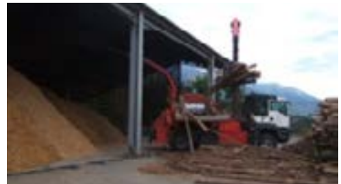
La plate-forme de bois décheté de la Communauté de communes de Serre-Ponçon

Pour poursuivre son action en faveur de la structuration de la filière bois énergie, la Communauté de Communes de Serre Ponçon est partenaire des projets MOB+ et Bois+05 dans le cadre de l'appel à manifestation d'intérêt DYNAMIC Bois de l'Ademe de 2015 puis 2016.