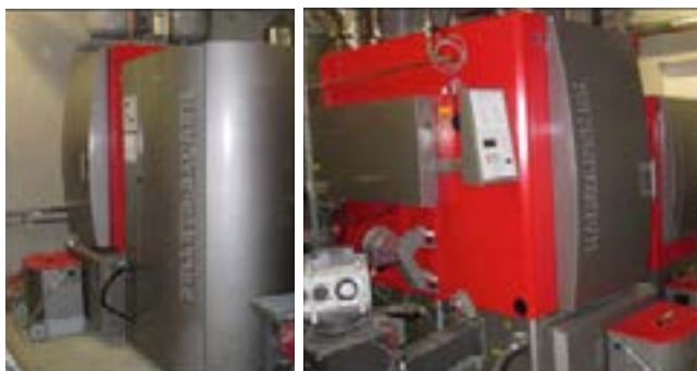
Chaudières 1 et 2

La chaufferie de l'ENAC est conçue pour fonctionner au granulé de bois l'hiver et au bois déchiqueté l'été. Ce choix permet de réduire le volume de stockage de combustible et donc le coût du génie civil. En effet, 1 m 2 stocke 660 kg de granulé contre seulement 150 à 200 kg de bois déchiqueté. Une chaufferie mixte granulés/bois déchiqueté peut donc constituer un bon compromis entre le montant de l'investissement, la facilité d'exploitation et le coût de l'énergie.