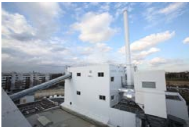
La chaufferie de Fort de l'Est à Saint-Denis

Le réseau délivre un total de 350 GWh/an et des extensions à hauteur de 75 GWh/an sont envisagées. Il mesure 60 km et dessert 400 sous-stations et 40 000 équivalents-logements.