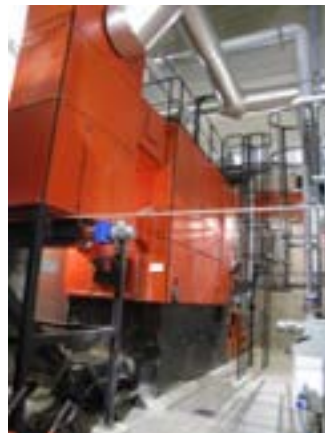
La chaudière bois Weiss de 2,4 MW

La région Grand Est possède sur son territoire deux centrales de cogénération au bois-énergie, à Epinal (Vosges) et Forbach (Moselle). Ces équipements qui consomment d'importants volumes de bois (150 000 t/an) ont contribué à structurer une filière régionale d'approvisionnement en bois qui bénéficie aussi aux plus petites chaufferies de collectivités, notamment celles situées en dehors des secteurs boisés comme Yutz.