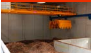
Le silo de 980 m 3 est équipé d'un grappin.

« Grâce aux réseaux de chaleur, comme celui de la Gauthière alimenté majoritairement par la biomasse, nous pouvons augmenter significativement la part des énergies renouvelables (EnR) sur notre territoire. Ce projet participe donc activement à l'atteinte de nos objectifs en termes de réduction de GES et de part d'EnR. Il permet également d'améliorer la qualité de l'air en remplaçant des solutions individuelles plus polluantes par une chaufferie biomasse centralisée et très réglementée. Nous sommes très attentifs à cet aspect de la qualité de l'air qui est très contrôlée. Des contrôles réglementaires ou inopinés sont régulièrement opérés et notre assistant au suivi de la DSP est très vigilant sur cette question. De plus, la Ville de Clermont-Ferrand a demandé à Atmo Auvergne de faire des mesures complémentaires dans un périmètre à proximité de la chaufferie pendant 6 ans autour de sa mise en service (avant et après). Ces mesures qui portaient notamment sur les HAP n'ont montré aucun impact de la chaufferie biomasse sur la qualité de l'air. »