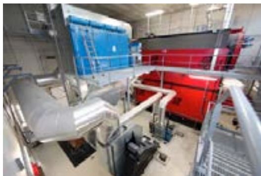
La chaufferie bois de 7,7 MW du quartier de La Gauthière

La densification ou l'extension du réseau de chaleur en dehors du périmètre délégué est une solution intéressante pour améliorer son équilibre financier. La réalisation d'un schéma directeur du réseau recense les souhaits de raccordements des bailleurs sociaux, industriels ou autres acteurs privés proches. Cette opportunité leur permet de réduire le montant de leur Contribution Climat Energie et d'alléger leurs contraintes réglementaires en sous-traitant une partie de la production d'énergie. Un travail de pédagogie est cependant nécessaire pour expliquer le fonctionnement contractuel, technique et financier du réseau.