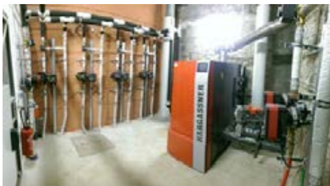
La chaudière consomme environ 50 t/an de plaquettes forestières.

Pour soutenir les projets de chaufferies bois, l'Agence de l'Urbanisme et de l'Energie de la Corse (AUE) et l'ADEME mettent en œuvre des programmes d'aides cofinancés par l'Europe (FEDER), le CPER et EDF. L'appel à projets « bois-énergie 2016 » a permis de sélectionner 2 projets de réseaux de chaleur bois à Corte et Fiumorbu (4 MW au total). L'appel à projets 2017 doté de 2 M€ de budget pourrait permettre de concrétiser des projets à Livia, Munaccia d'Audè, Sartè et Aleria. Un poste d'animateur bois-énergie a été mis en place au sein de la coopérative Silvacoop pour faire émerger d'autres projets entre 2017 et 2019.