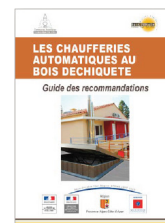
Les chaufferies automatiques au bois déchiqueté