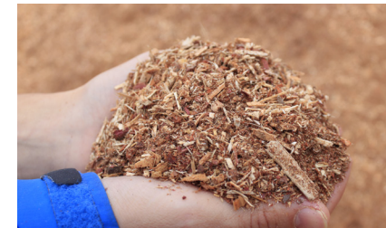
Fines éliminées par criblage