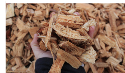
Gros morceaux éliminés par criblage