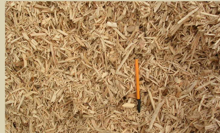
Bois en fin de vie