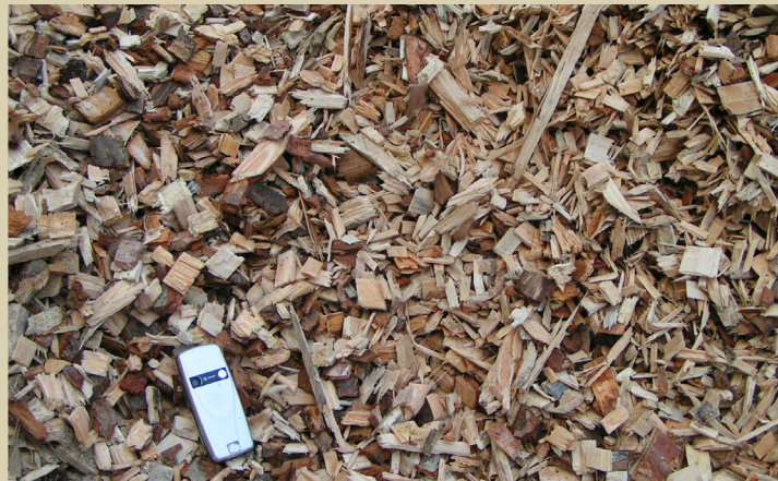
Plaquettes de scierie