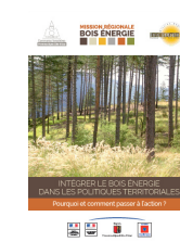
Intégrer le bois énergie dans les politiques territoriales