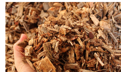
Plaquette non criblée

⚠ Attention : si le combustible est de mauvaise qualité au départ (présence de cailloux par exemple), le criblage ne permettra pas nécessairement de tout éliminer.