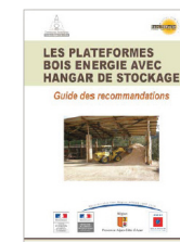
Les plateformes bois énergie avec hangar de stockage