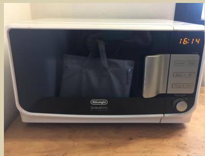
Four à micro-ondes