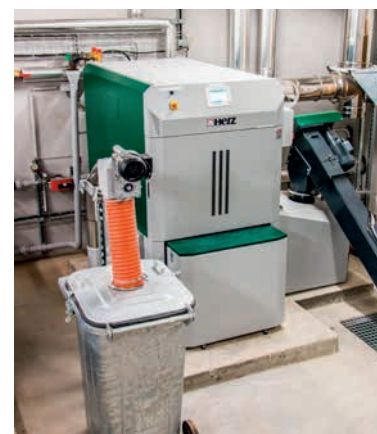
HERTZ FIREMATIC, 130 kW