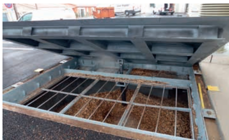
Silo enterré avec trappe carrossable