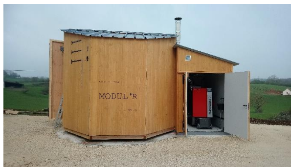
Chaufferies modulaires de la SCIC Bois Energie Lot